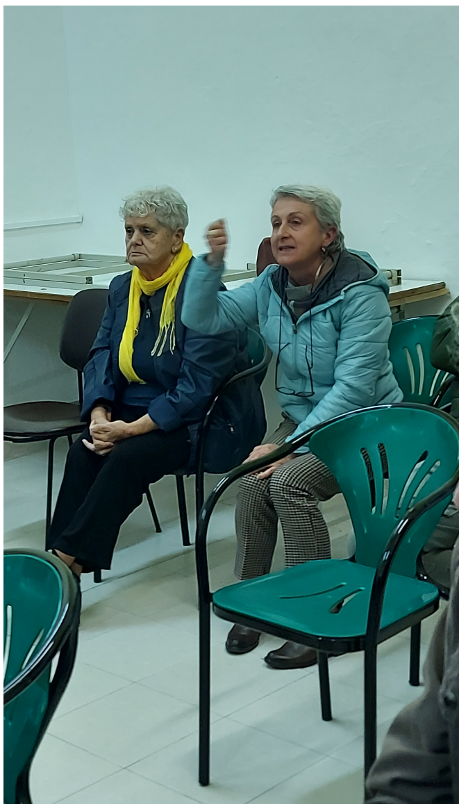
Il dibattito con i partecipanti