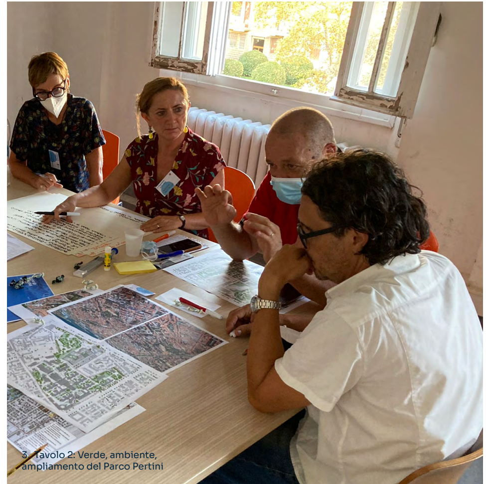
3 | Tavolo 2: Verde, ambiente, ampliamento del Parco Pertini