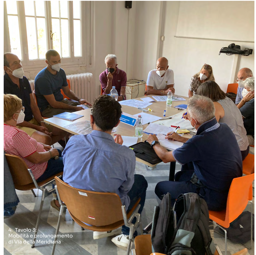
4. Tavolo 3: Mobilità e prolungamento di Via della Meridiana

I tecnici rispondono che saranno previsti 400 nuovi posti auto in fondo al prolungamento di via Meridiana ma un partecipante obietta che tale intervento non è coperto da finanziamenti.