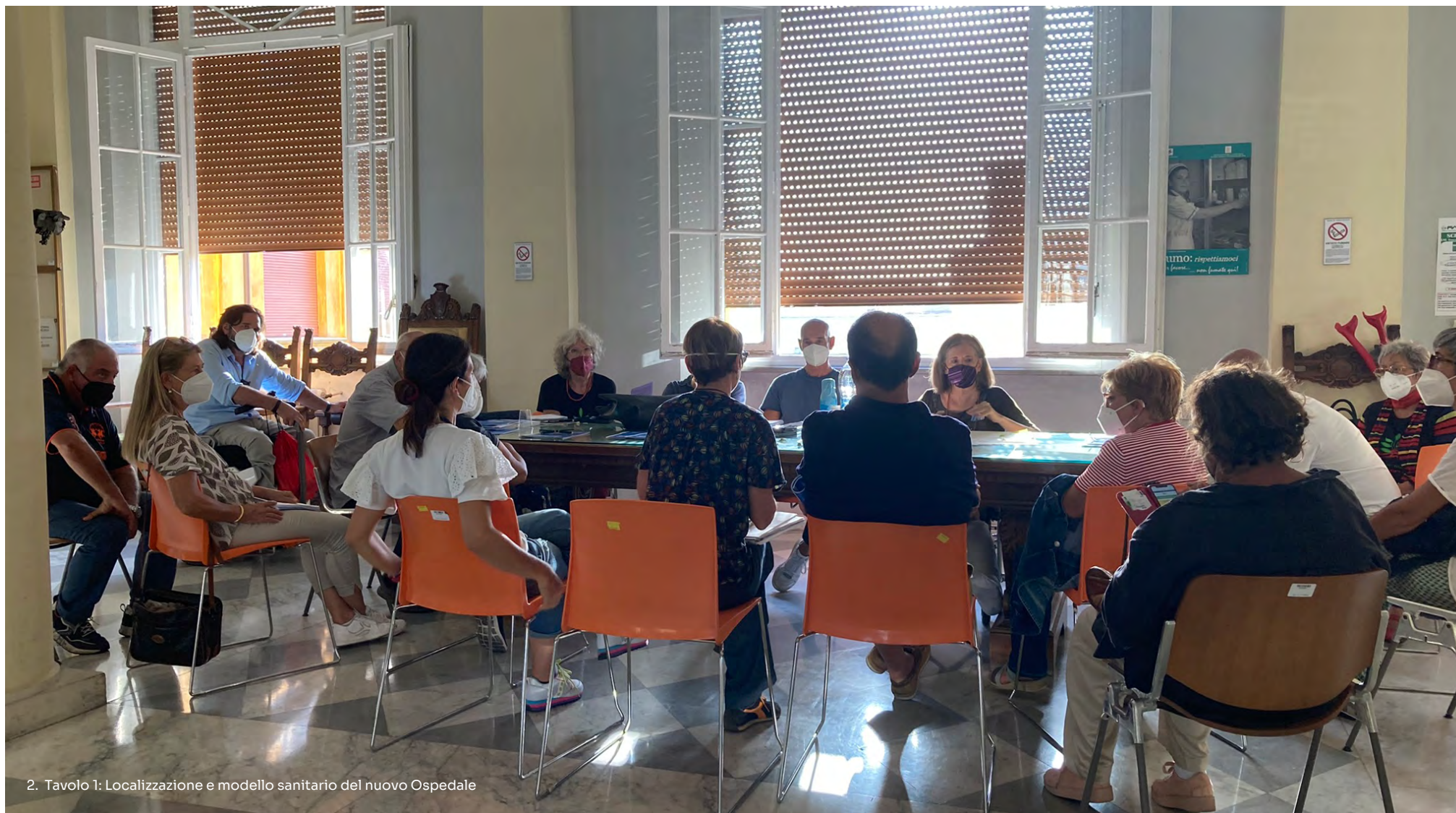
2. Tavolo 1: Localizzazione e modello sanitario del nuovo Ospedale