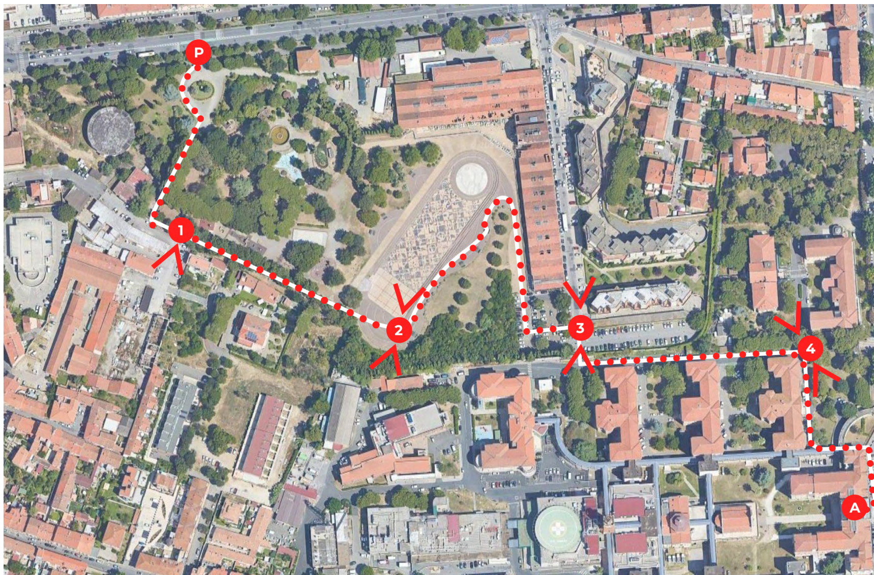
1. Le tappe del percorso