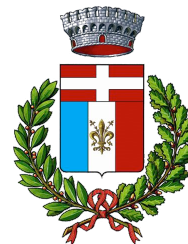
Comune di San Godenzo

Vi invitiamo a partecipare agli appuntamenti previsti per questo importante momento di informazione e riflessione per le comunità, realizzato in collaborazione con Anci Toscana e con il contributo dell'Autorità regionale per la garanzia e la Promozione della Partecipazione: