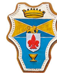
Comune di Dicomano

Giovedì 26 aprile ore 21 > Biblioteca comunale > Dicomano Incontro con le categorie economiche