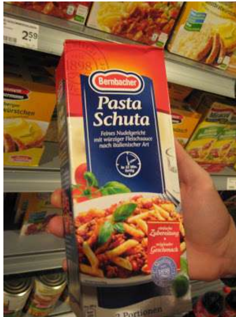
Figura 3: esempio di italian sounding

olio di oliva) . Lo stesso effetto si manifesta sui mercati esteri attraverso il fenomeno dell'italian sounding: si spacciano per italiani alimenti che italiani non sono e di discutibile gusto e salubrità per il solo fatto che cibo italiano è nel mondo sinonimo di qualità.