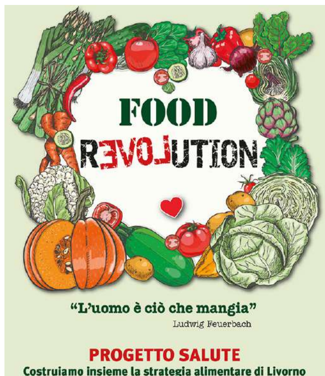
Figura 3 - Il simbolo del progetto SALUTE

Al di là della necessità di aggiungere vegetali ricchi di proteine (vegetali) quali i legumi (soia, ceci, piselli, lenticchie, fave, fagioli) e i cereali (avena, grano, farro, kamut, mais, miglio, orzo), su cui si è unitariamente convenuto, la discussione si è polarizzata sull'opportunità di aggiungere i cibi di origine animale (carne, pesce, formaggio).