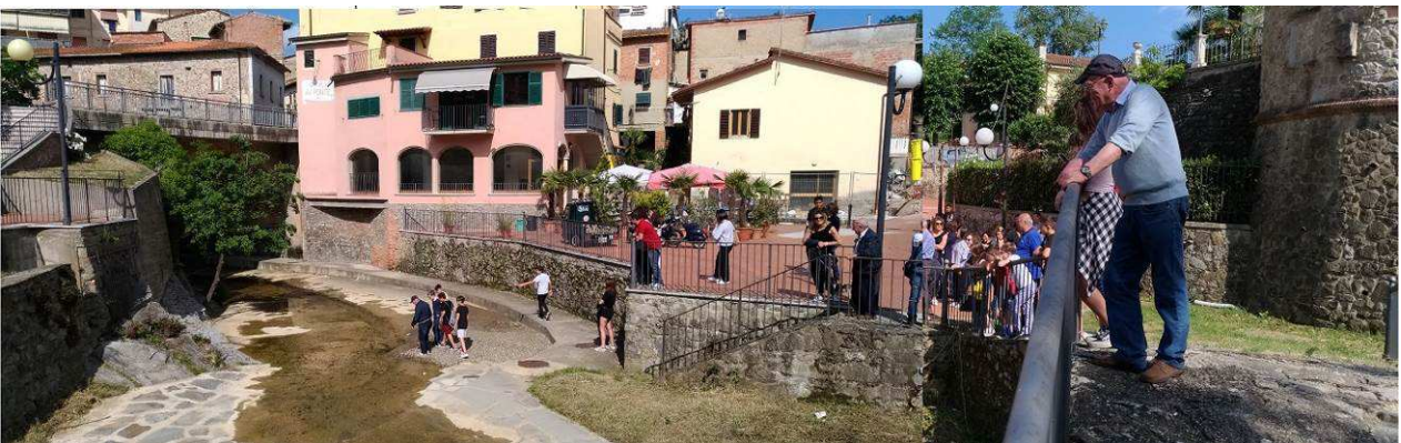
PONTE E FIUME