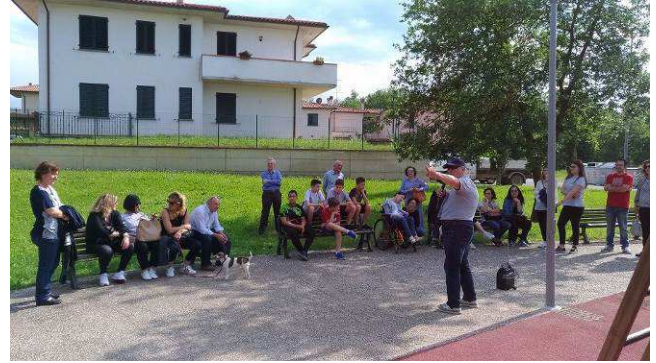
GIARDINI ABBÈ PIERRE