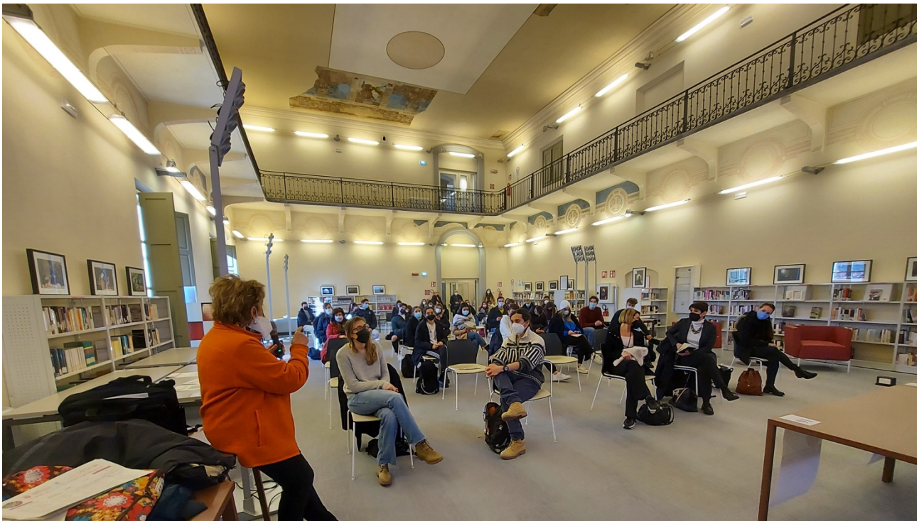
Il dibattito finale