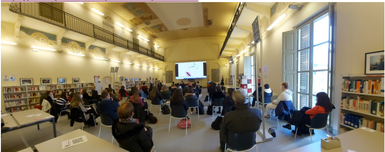
La proiezione del video di Labsus

https://www.youtube.com/watch?v=Qn5oIHGJDss