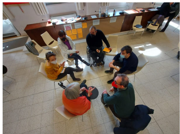
I lavori dei gruppi di discussione