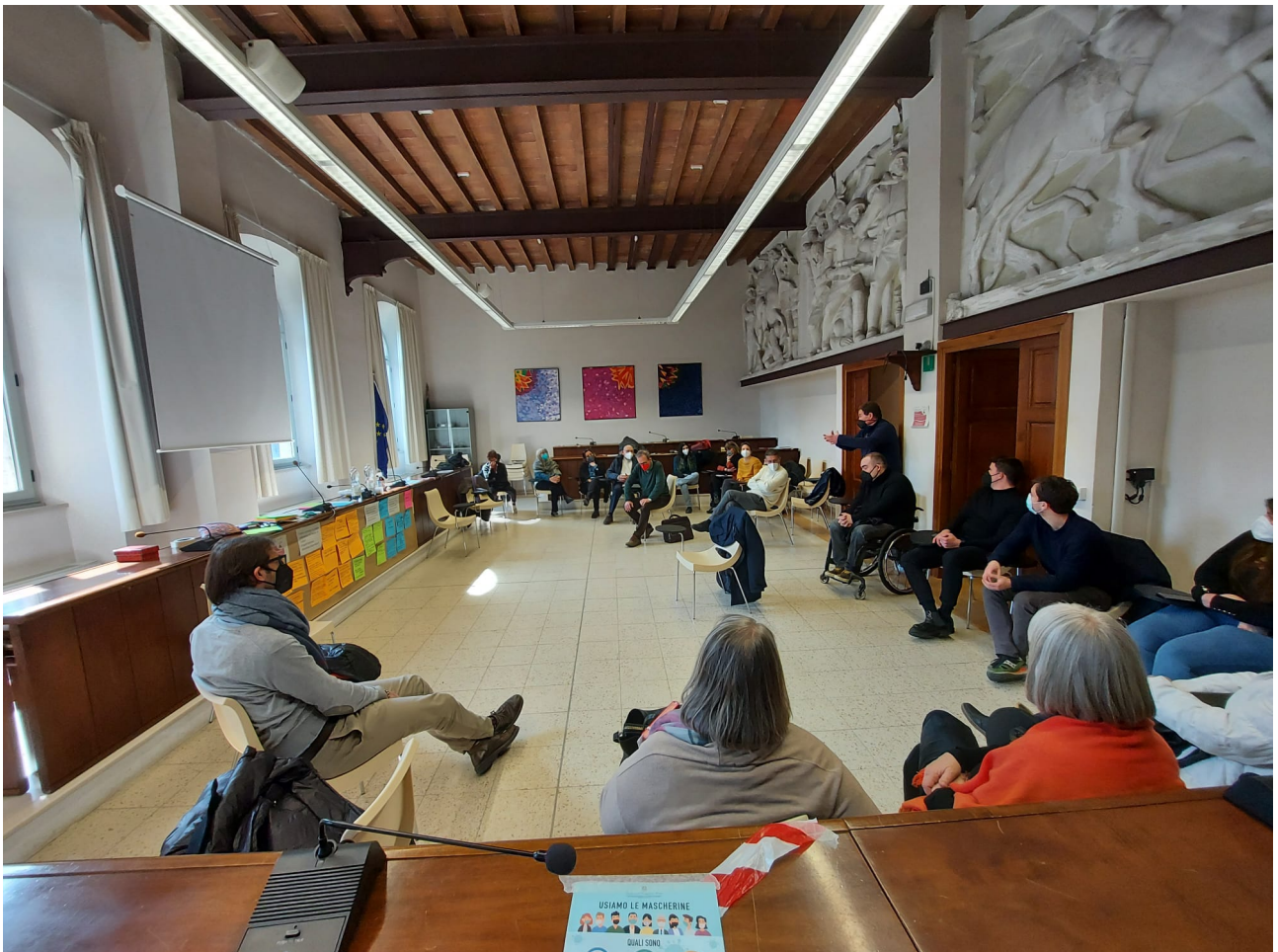
I commenti nella plenaria finale