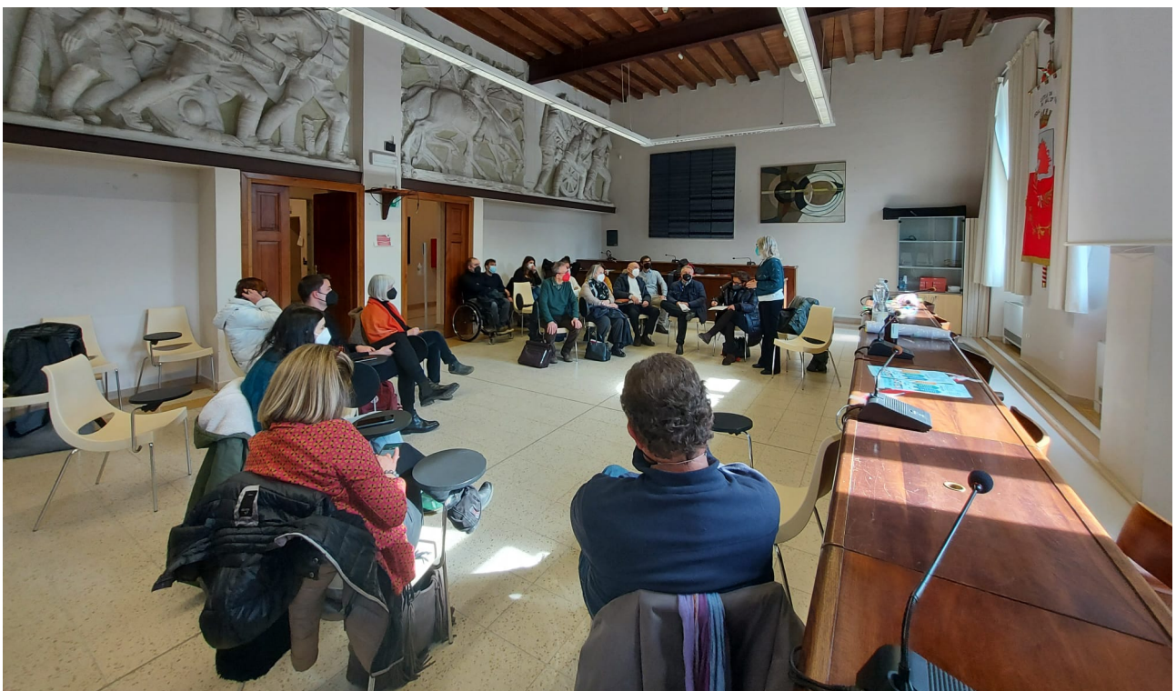
I saluti iniziali e la presentazione del progetto

Il processo si è concluso con una sessione plenaria in cui si sono susseguiti gli interventi di restituzione dei facilitatori e i commenti dei singoli partecipanti e dell'Amministrazione.