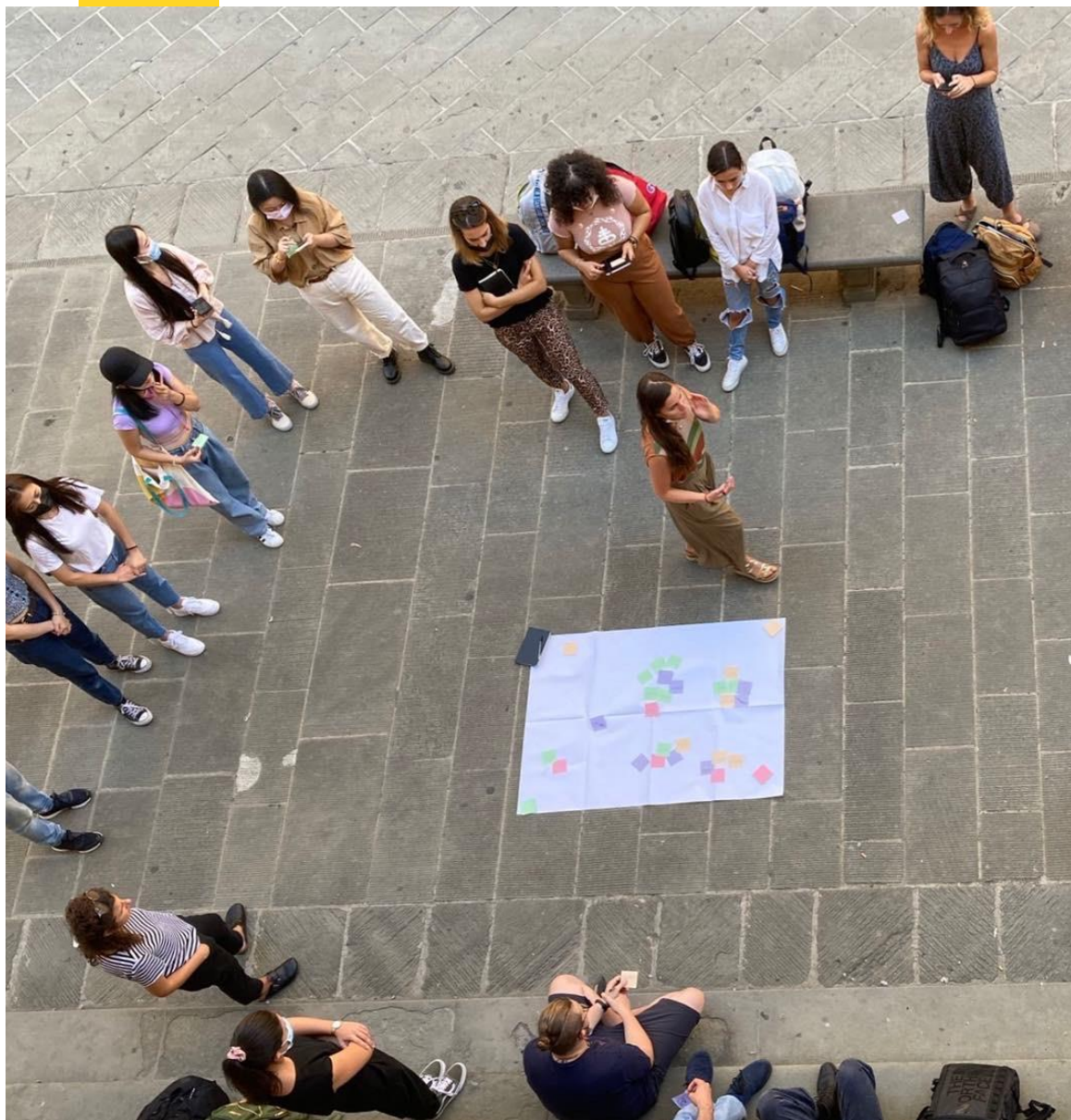
LABORATORIO DI NETWORKING