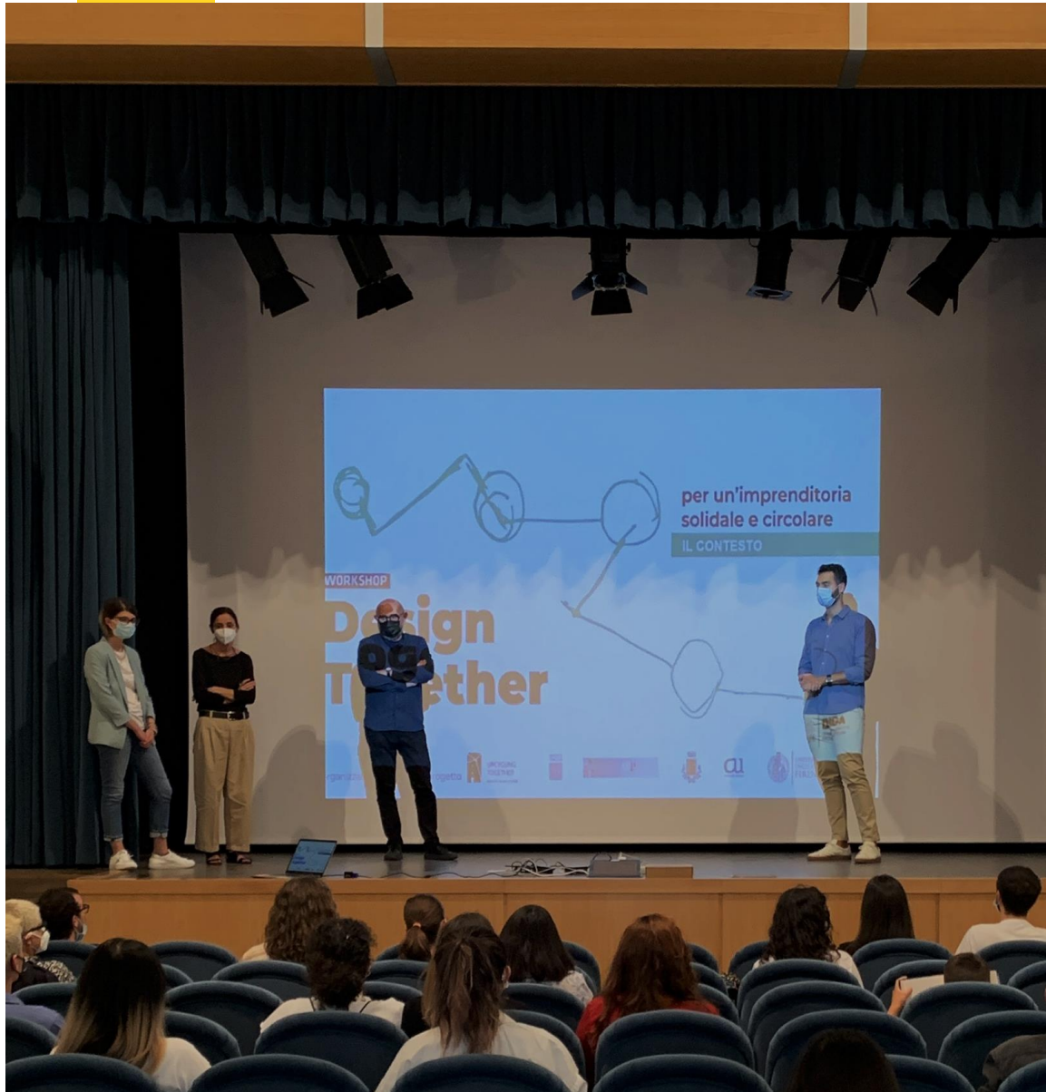
LABORATORIO DI NETWORKING