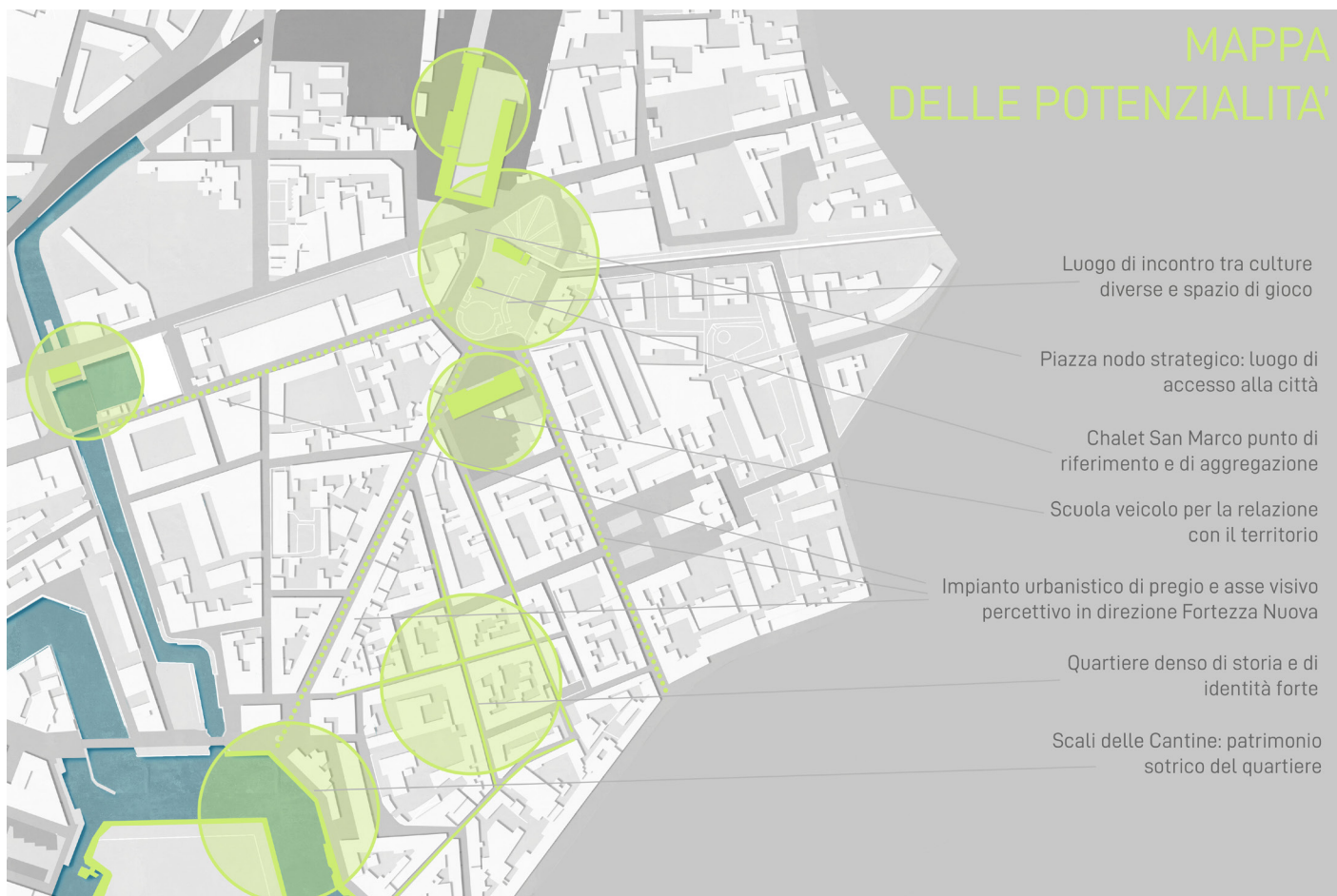
Figura 2. Graficizzazione degli elementi di potenzialità che insistono nella Piazza e nel quartiere, raccolti nella fase di ascolto