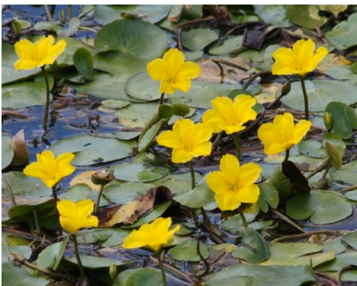
Nymphoides peltata, Seekanne

Froschbiss, impedisce alghe, ossigeno, invadente