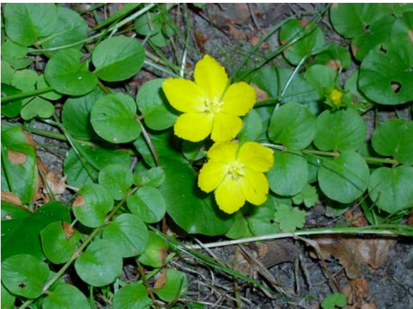
Lisimachia nummularia, Pfenningkraut,