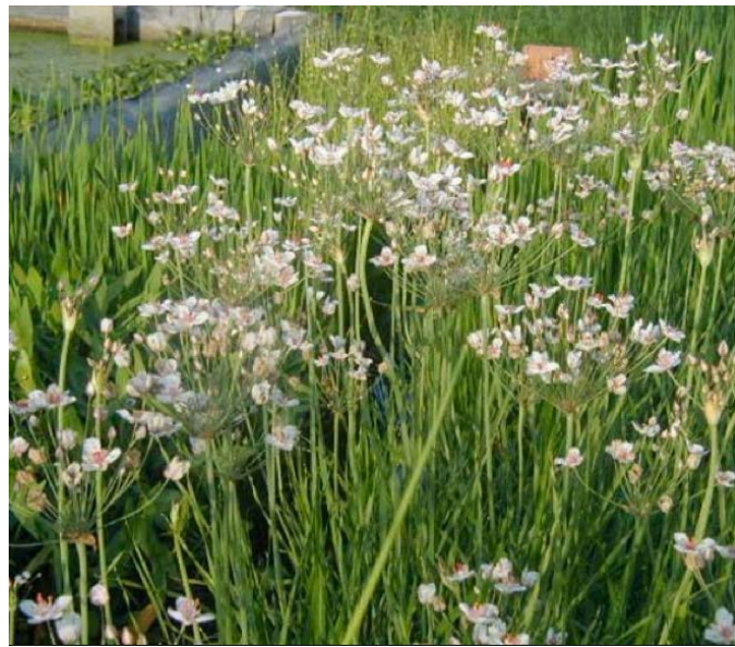
Botomus umbrellatus rosa e bianco, Blumenbinse