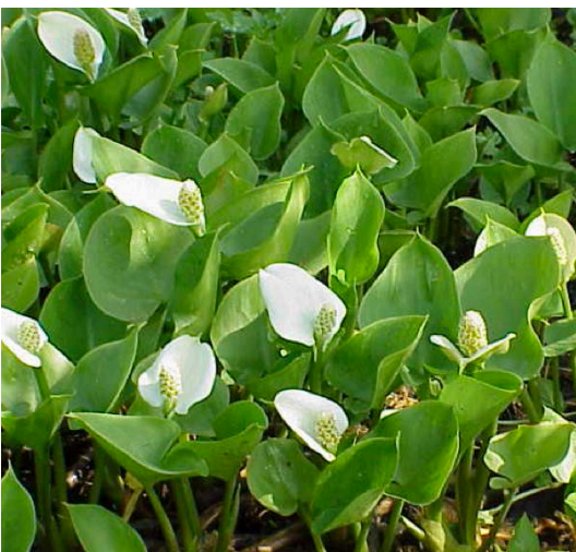
Calla palustris, Sumpfkalla