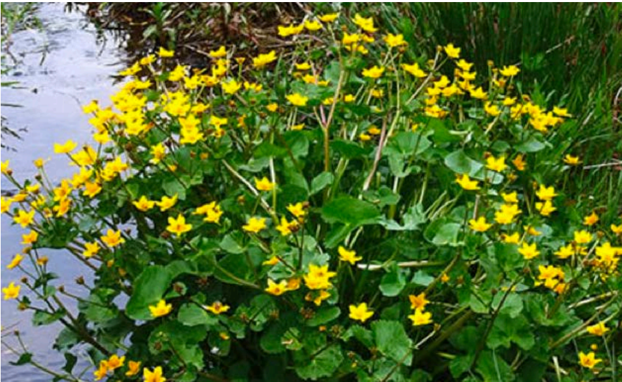
Calta palustre, Sumpfdotterblume