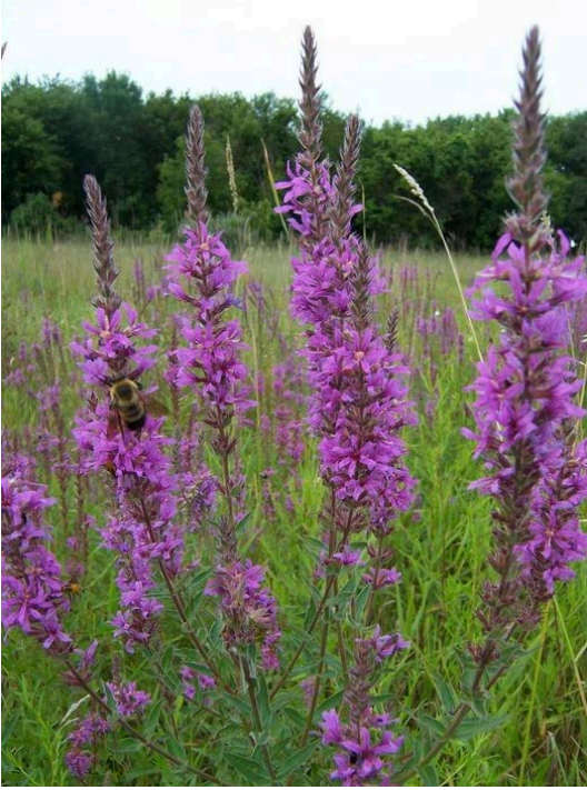
Lythrum salicaria, Blutweiderich