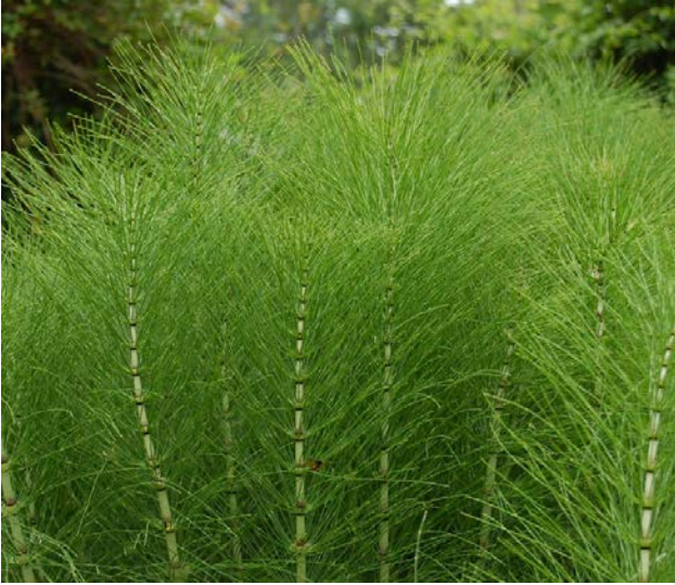
Equisetum palustre, Zinnkraut