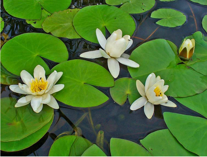
Nymphaea alba, Seerose