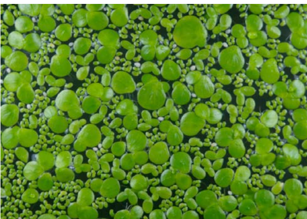
Lemna minore, kleine Seelinse, ottimo come cibo per anatre, invadente