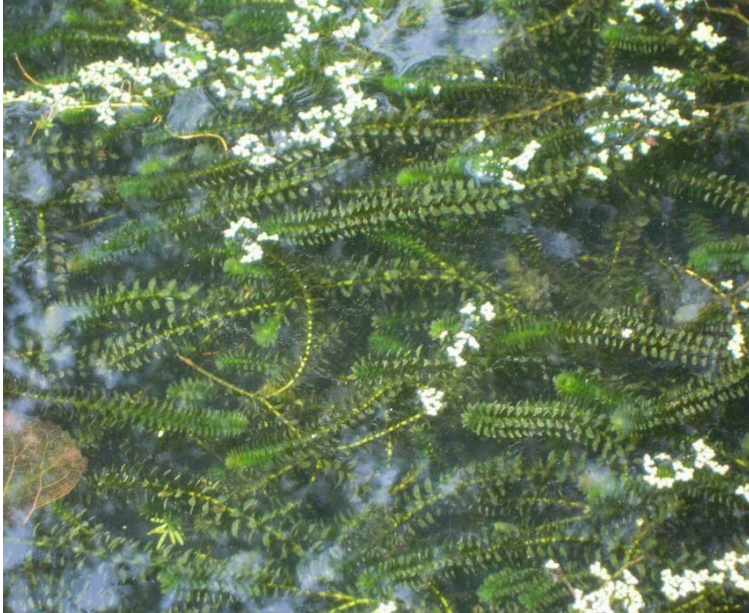
Eleodea canadensis, Kanadische Wasserpest, molto invadente per fondali