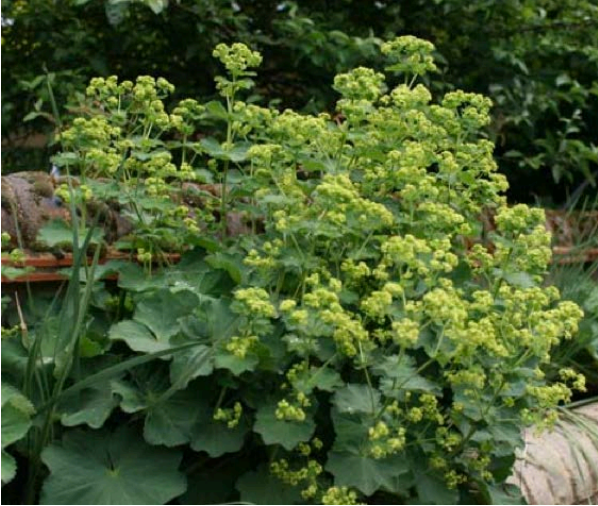
Alchemilla mollis , penombra