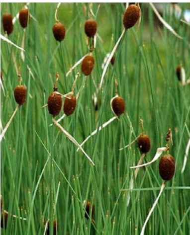
Tifa minima, Zwergrohrkolben