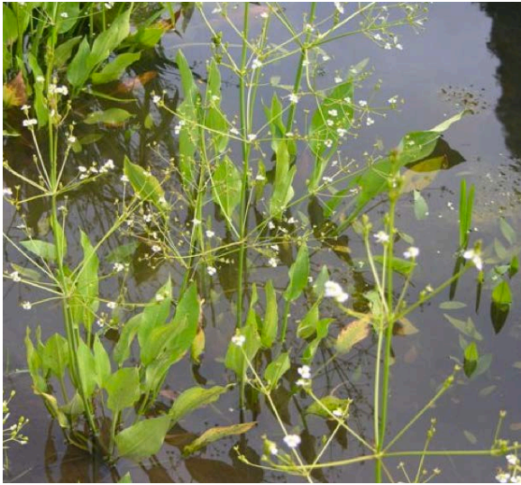
Alisma Plantago, Froschloeffel