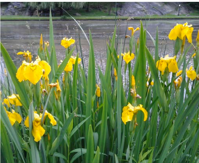
Iris pseudacorus, particolarmente