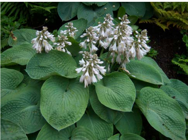
Hosta , penombra, Funkie