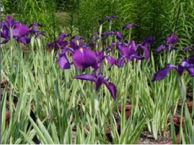
Iris Kaempferi variegato,