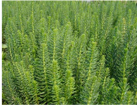
Hippurus vulgaris, Tannenwedel, produce ossigeno, invadente