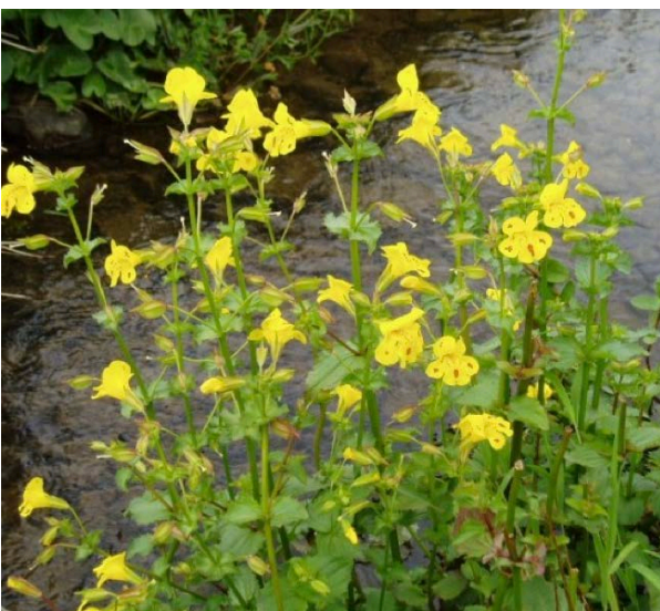
Mimulus luteus, Gelbe Gauklerpflanze