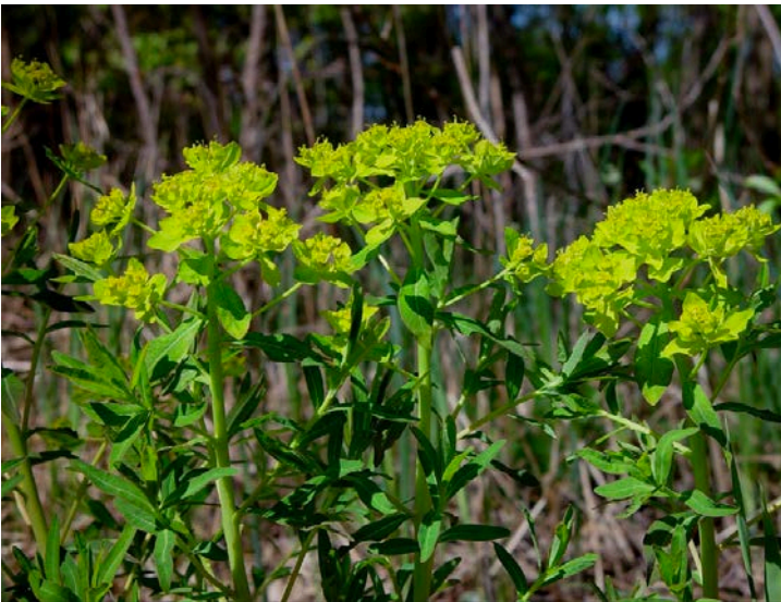
Euphorbia palustris , penombra