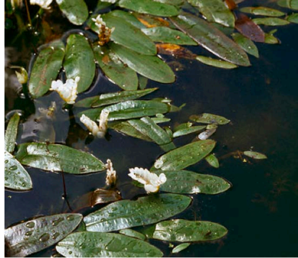
Aponongeteum distachius, Wasseraehre