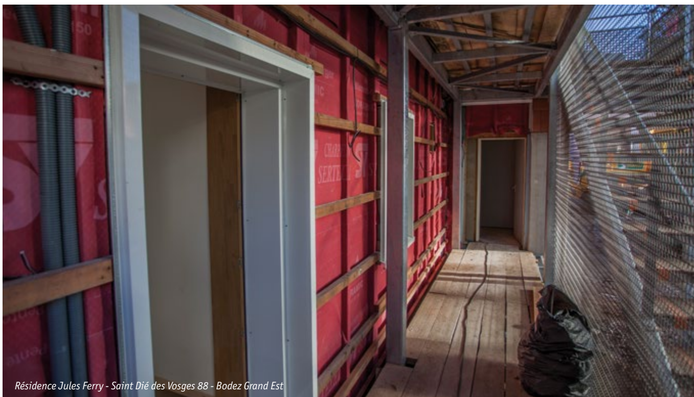
Résidence Jules Ferry - Saint Dié des Vosges 88 - Bodez Grand Est