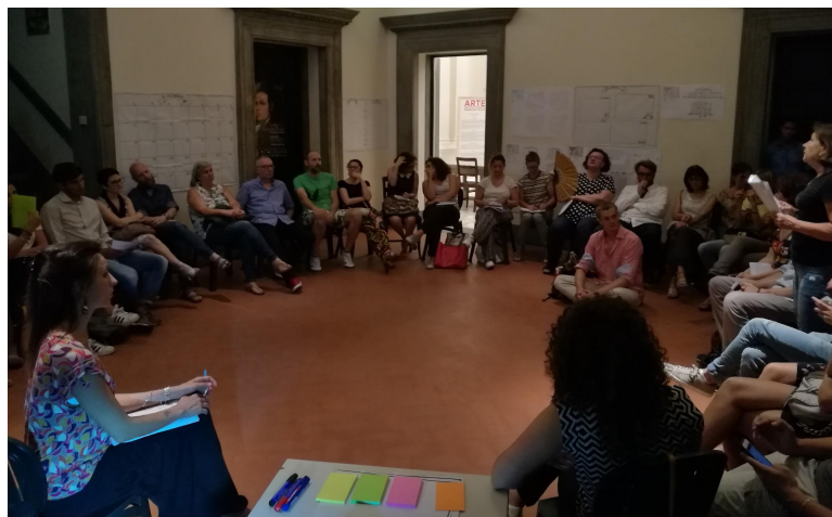
Il primo calendario