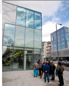
Idea Store Watney Market 2013