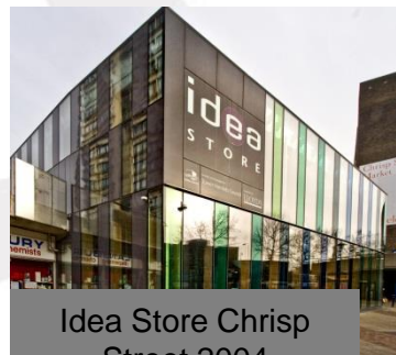
Idea Store Chrisp Street 2004