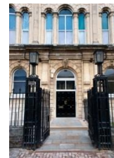
Local History Library & Archives