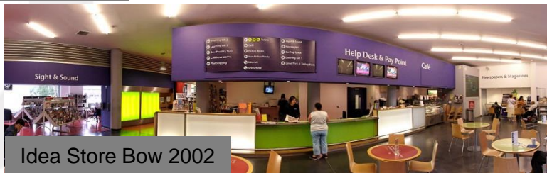
Idea Store Bow 2002