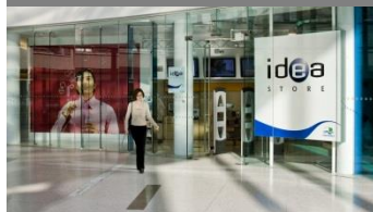
Idea Store Canary Wharf 2006