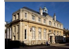
Cubitt Town Library