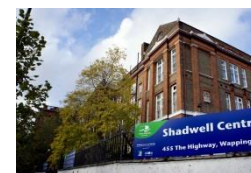
Shadwell Adult Learning Centre