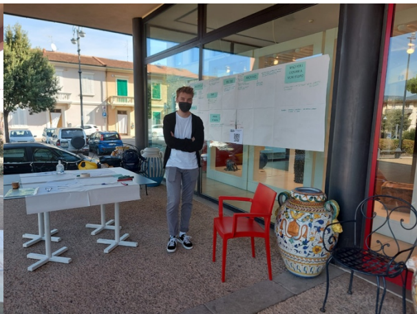
Due momenti del laboratorio