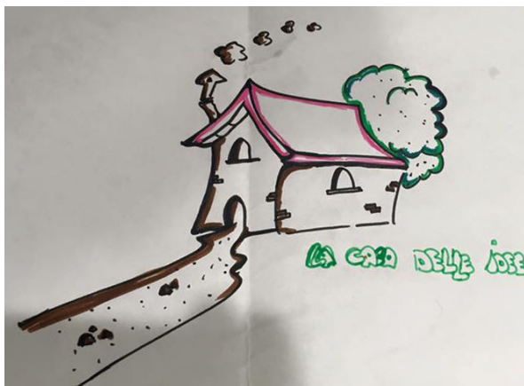
Un disegno sul tavolo

Infine in plenaria i partecipanti hanno riportato e confrontato idee e proposte emerse in modo più ricorrente dai tavoli, utilizzando anche gli appunti presi sulle loro tovaglie di carta.