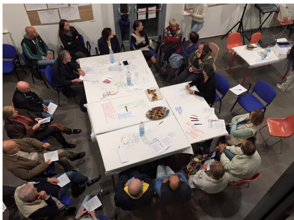
La plenaria finale