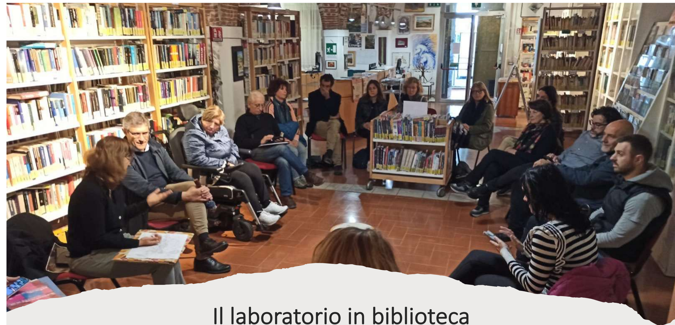
Il laboratorio in biblioteca