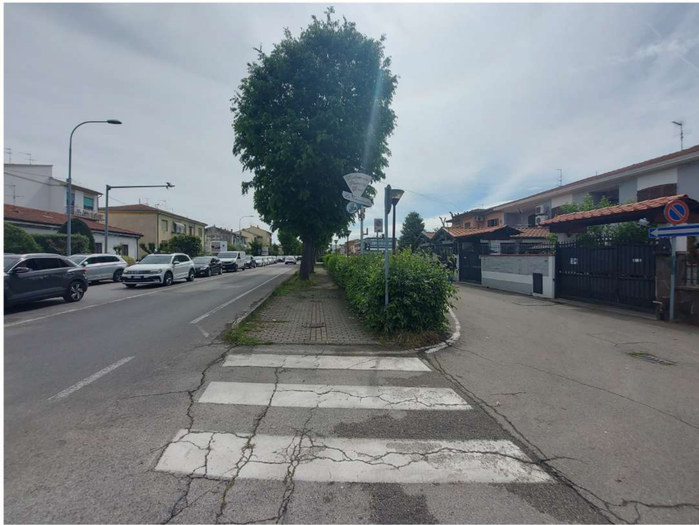
Via Tosco Romagnola