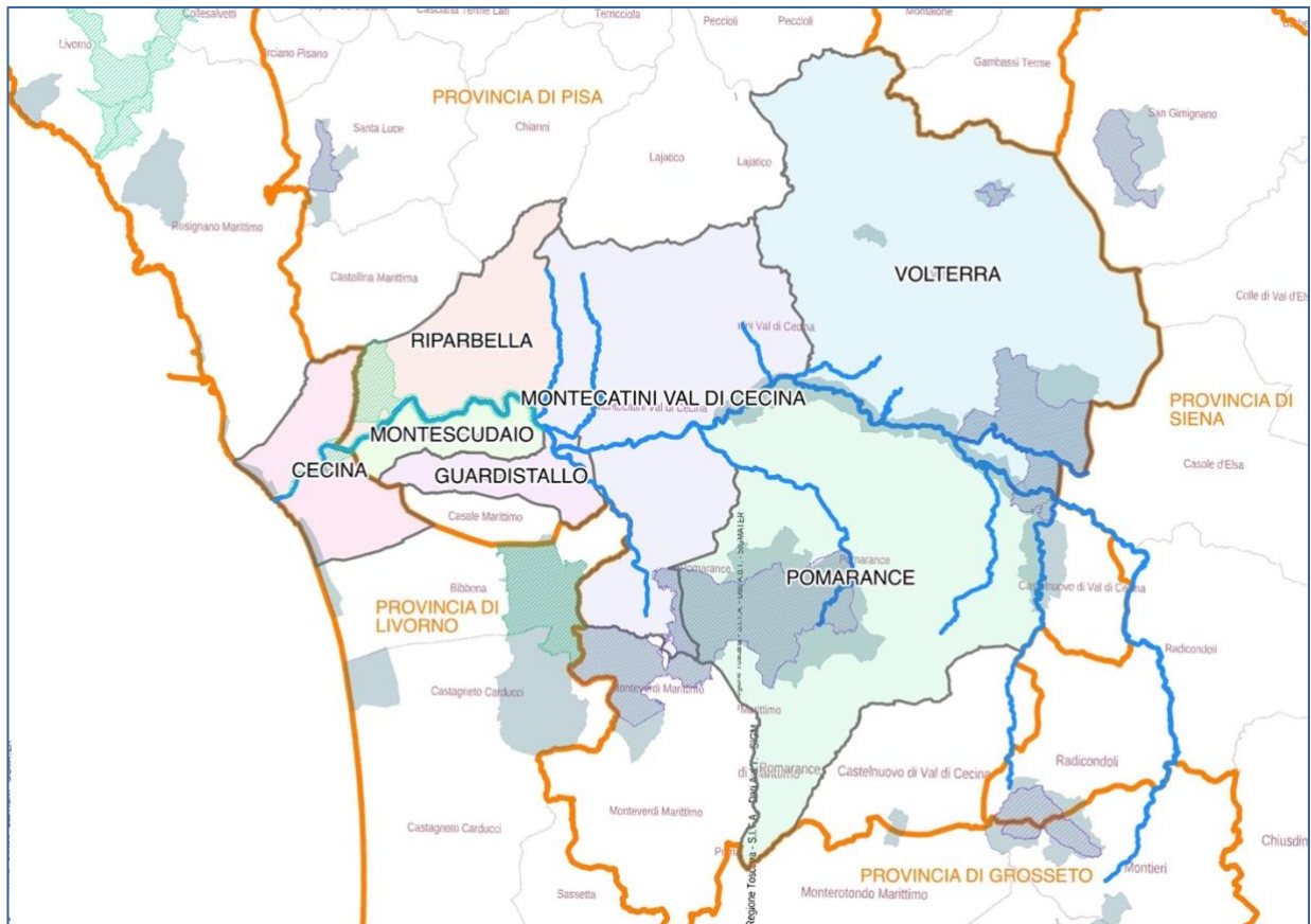
Cecina (LI) – 13 Maggio 2022